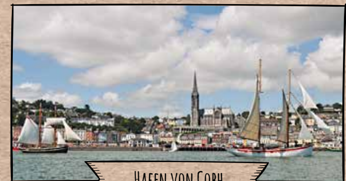
HAFEN VON COBH