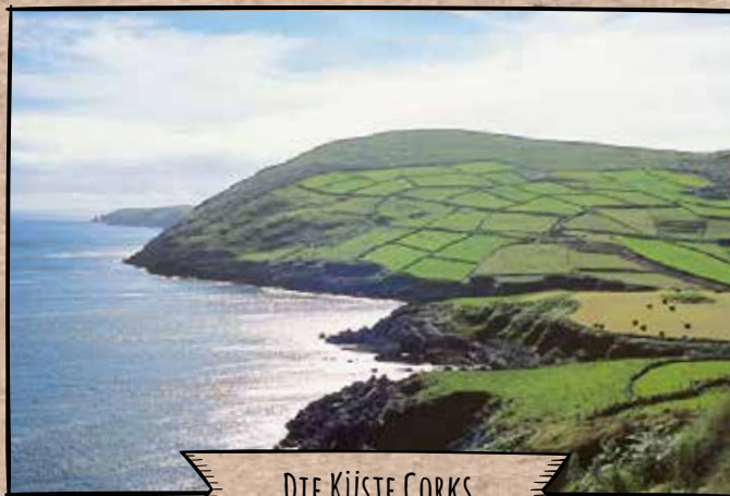
DIE KÜSTE CORKS

D unlough Castle, erbaut 1207 n.Chr., ist eine der ältesten Burgruinen Irlands. Ansonsten beschränkt sich das Sehenswerte der Grafschaft auf Landschaft und Natur, sowie auf die Städte und Dörfer entlang der Küstenlinie. Wichtiger Dreh- und Angelpunkt Corks ist der Hafen von Cobh ,