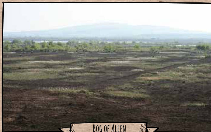
BOG OF ALLEN