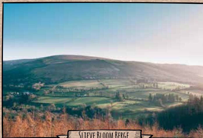
SLIEVE BLOOM BERGE

Die Lagerung in vier unterschiedlichen Fässern verleiht dem Tullamore einen enorm komplexen, fruchtig-würzigen Geschmack, jedoch rund und mit einer angenehmen Süße im Abgang.